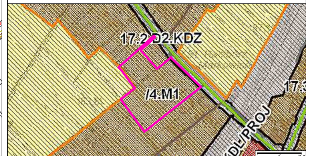
Wyrys ze Studium uwarunkowań i kierunków zagospodarowania przestrzennego miasta Raciborza (Uchwała Nr XXXVIII/575/2009 Rady Miasta Racibórz z dnia 30 grudnia 2009 r.)