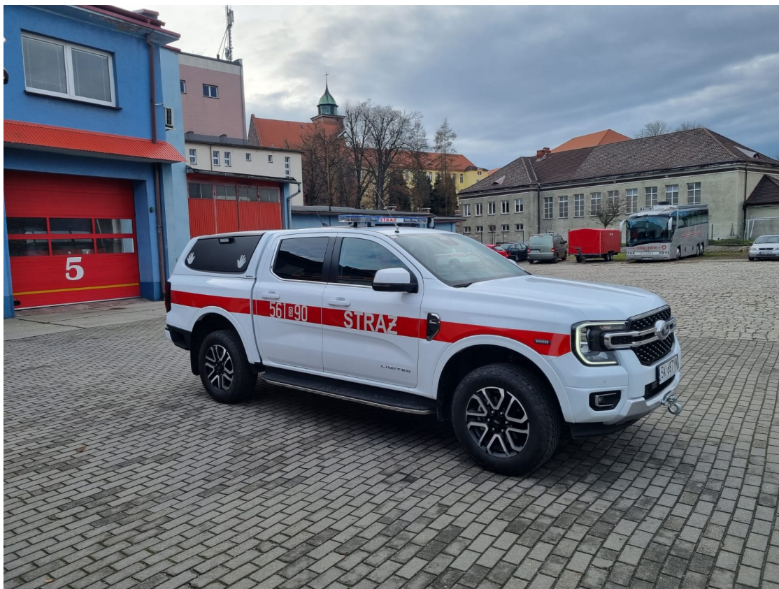
SLRr FORD RANGER