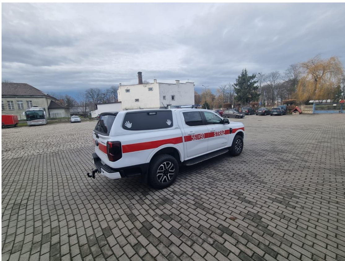
SLRr FORD RANGER