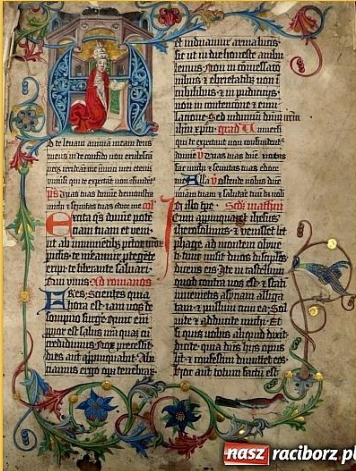
Fot. 1: Karta z Mszału raciborskiego

- A(d te levavi): papież Grzegorz I.