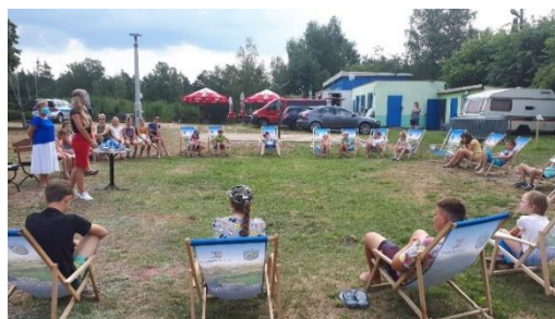
Pogadanki w ramach akcji „Bezpieczne wakacje 2020”