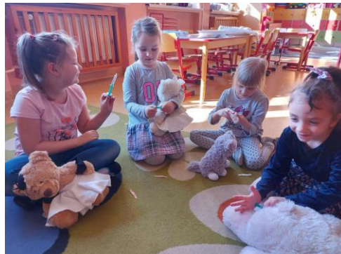
Pogadanki/spotkania w ramach zajęć „Zaszczep w sobie chęć szczepienia” w Raciborzu.