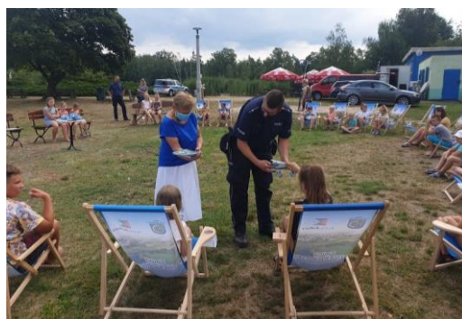
Pogadanki w ramach akcji "Bezpieczne wakacje 2020".

Uczestnikom spotkań przedstawiono zasady profilaktyki i bezpieczeństwa w okresie występowania pandemii wirusa SARS-CoV-2. Dostarczano podstawowych informacji dot. zagrożeń płynących z zażywania tzw. dopalaczy i tym samym podniesiono świadomość o problemach zdrowotnych i konsekwencjach prawnych wynikających z używania nowych narkotyków. Poruszono temat bezpiecznego opalania oraz omówiono temat bezpiecznego korzystania z kąpielisk, a także zachowaniu się podczas wycieczek górskich, burzy, pobytu w lesie oraz profilaktyce i zasadach postępowania w przypadku ukąszenia przez kleszcze i owady. Uczestników obozów ostrzegano także przed niebezpieczeństwem przegrzania organizmu i udarem cieplnym. Zwrócono uwagę na korzyści wynikające ze szczepień ochronnych oraz ich znaczenie w profilaktyce chorób zakaźnych. Omówiono także zagrożenia wynikające z czynnego i biernego palenia tytoniu. Organizatorom przekazano materiały edukacyjno-informacyjne (plakaty, ulotki) do rozdysponowania oraz wyeksponowania na terenie placówek.